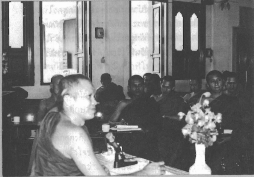
นิสิตบัณฑิตวิทยาลัย มหาวิทยาลัย กิ่งผึ้ง องค์กรบวรชัย